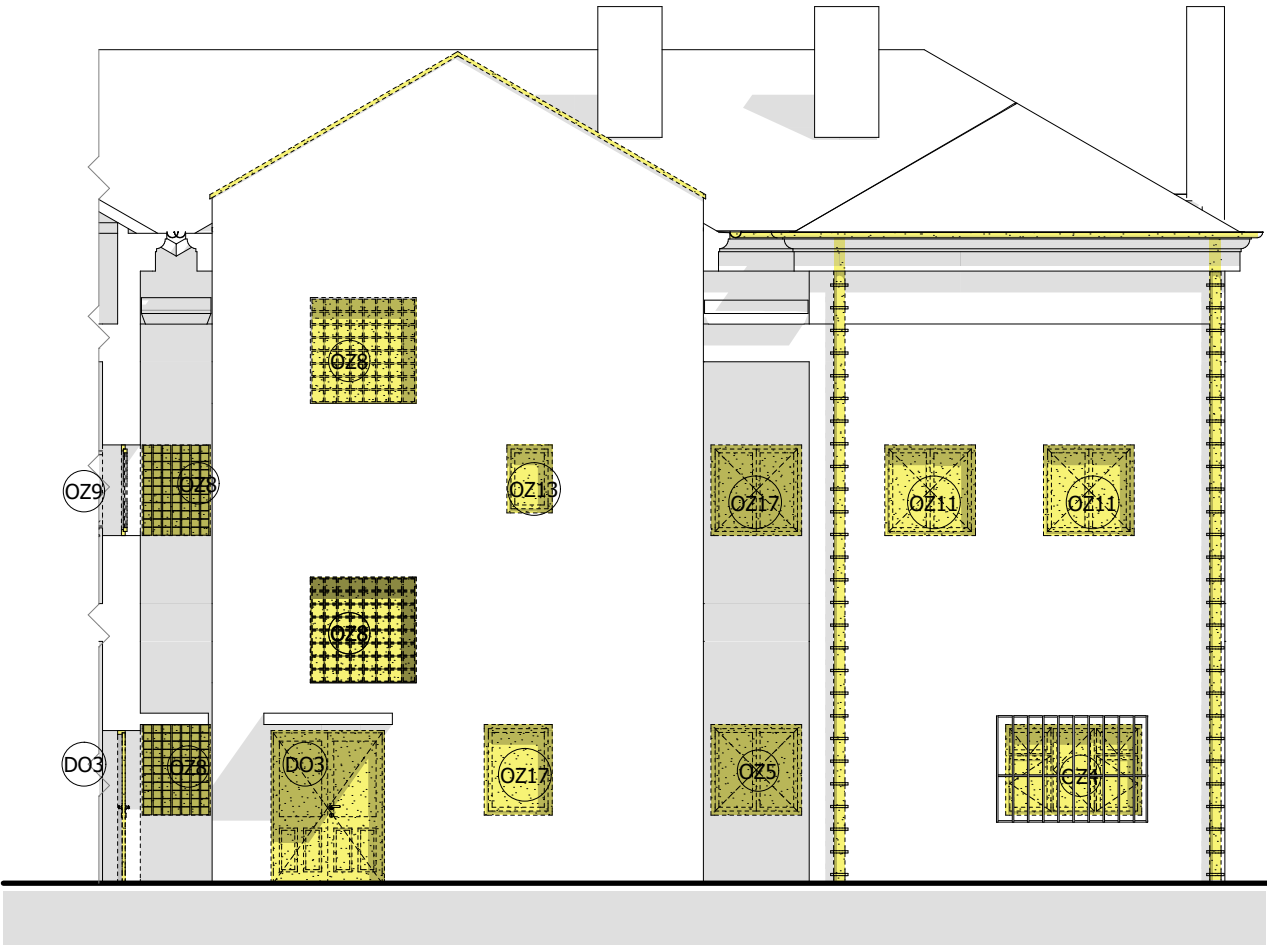
POHLED SEVERNÍ 2 - DVORNÍ